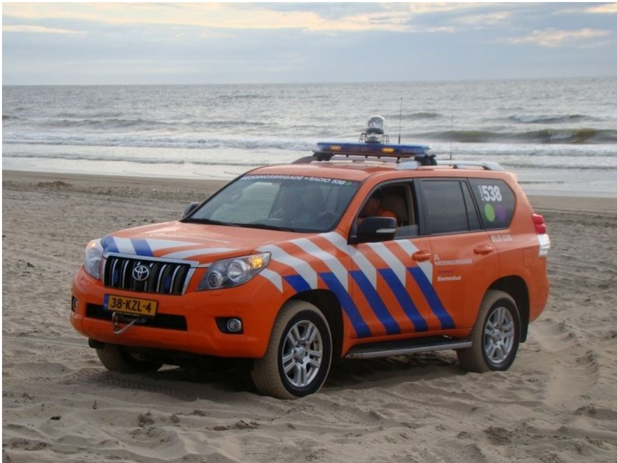
Strandambulance Reddingsbrigade Bloemendaal

Hierbij wordt altijd naar het belang van de patiënt gekeken.