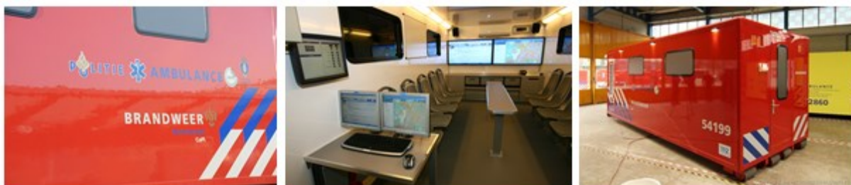
Copi container regio Kennemerland

Bij een grote of langdurig calamiteit zal er een zogenaamd CoPI worden opgezet. Dit staat voor Commando Plaats Incident. Hiervoor beschikt de brandweer over een CoPI container. Bij een calamiteit op het strand zal deze CoPI container op de boulevard worden geplaatst. Er zal dan een nieuwe commandostructuur opgezet moeten worden. Over het algemeen gaat de commandostructuur van het strand verder. In de CoPI container zullen beleidsmatige beslissingen worden genomen. Aansturing en coördinatie vindt dan verder plaats vanuit het CoPI overleg. De Coördinator Reddingsbrigade heeft in dit overleg alleen maar een ondersteunende rol.